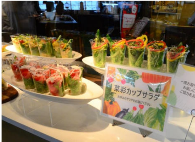
サラダはカップサラダ形式で華やかに。

天神イムズビル13Fの「野の葡萄 天神イムズ店」では、新型コロナウイルス感染拡大に伴い、ビュッフェスタイルでの営業を中止しておりましたが、「ビュッフェはまだしてないんですか？」というお客様からのありがたいお問い合わせも多数頂く中、いかに安全にお客様にお食事をお楽しみいただくか？という点を重視し、検討に検討を重ねた結果、「新しい生活様式に則った安心+安全なカフェテリア方式でのメイン付きビュッフェという形で営業を再開致しました。