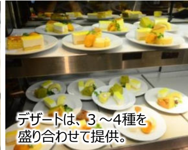
デザートは、3~4種を盛り合わせて提供。