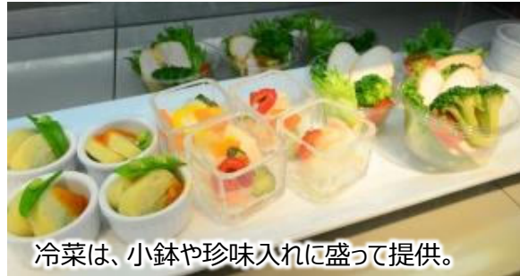
冷菜は、小鉢や珍味入れに盛って提供。