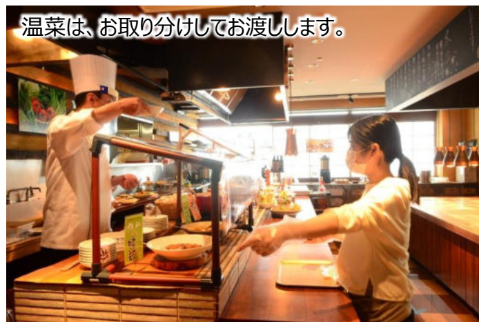
温菜は、お取り分けしてお渡します。