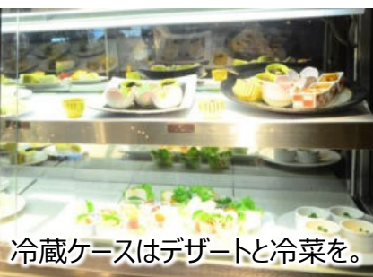
冷蔵ケースはデザートと冷菜を。